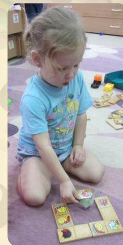
Постройки собственного конструирования «Зоопарк»