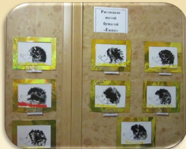
Рисование мятой бумагой «Ёжик»