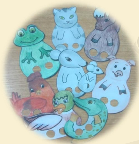
Пальчиковый театр «Сказка о глупом мышонке»