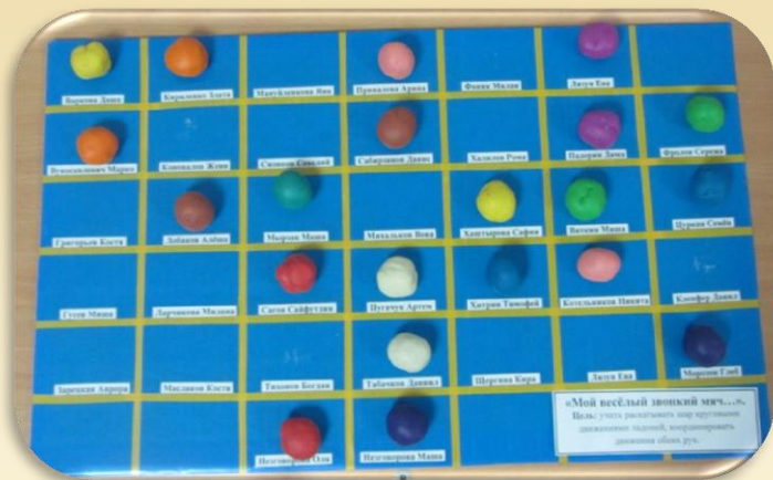
Лепка «Мой веселый звонкий мяч»